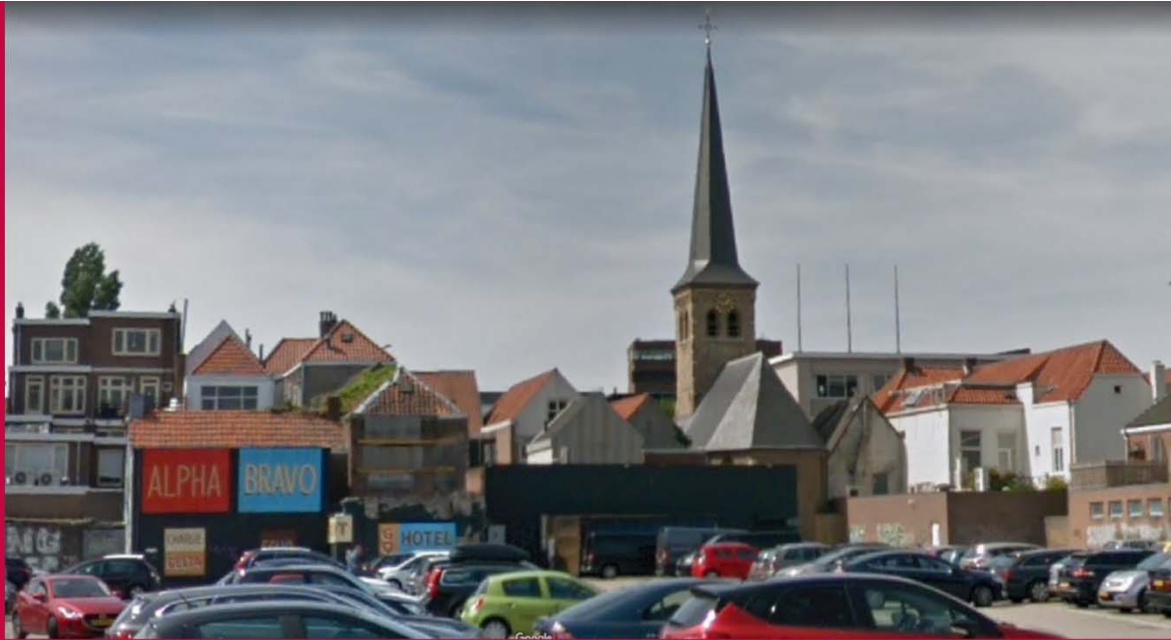
2018, Keizerstraat Breda