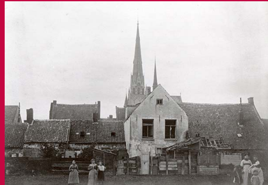
Bouwvallige achterkant van de Keizerstraat in 1912, gezien vanaf het Nonnenveld.