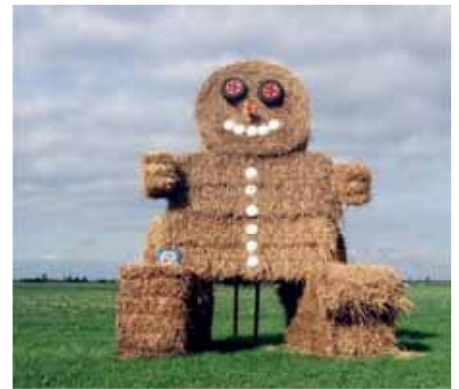
Ook stromanconstructies kunnen via Wet Bibob worden aangepakt.

Omgevingswet gemeenten de mogelijkheid om voor bepaalde omgevingsplanactiviteiten zelf te kiezen wanneer deze vergunningplichtig, meldingsplichtig of vergunningvrij zijn.