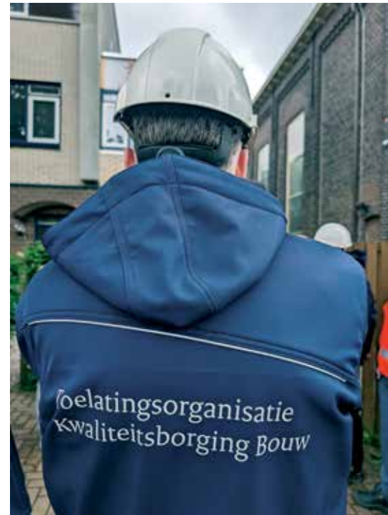
Om te beoordelen of naleving van de instrumenten voor kwaliteitsborging ook leidt tot een betere bouwkwaliteit, inspecteren TloKB-inspecteurs jaarlijks 5 procent van alle bouwwerken op de bouwplaats.

Binnen het KB-stelsel staat de samenwerking tussen kwaliteitsborgers, instrumentaanbieders en gemeenten centraal. De TloKB heeft als overkoepelende rol om te controleren of het stelsel van kwaliteitsborging goed werkt. Ze toetst instrumenten van instrumentaanbieders, laat deze toe en kijkt of instrumentaanbieders hun werk goed doen. Daarvoor gaan TloKB-inspecteurs langs bij de instrumentaanbieders voor een nalevingsinspectie. Om te beoordelen of naleving van de instrumenten ook leidt tot een betere bouwkwaliteit, inspecteren ze jaarlijks 5 procent van alle bouwwerken op de bouwplaats. “Deze week ben ik op een bouwplaats geweest in Poeldijk, dicht bij ons kantoor in Rijswijk”, legt TloKB-inspecteur Rogier uit. “Volgende week ga ik door naar Urk. Mijn collega’s en ik reizen door heel het land. Een bouwplaatsinspectie kondig ik twee weken ervoor bij de bouwer aan, waarna ik stukken krijg en het bezoek voorbereid. Op de